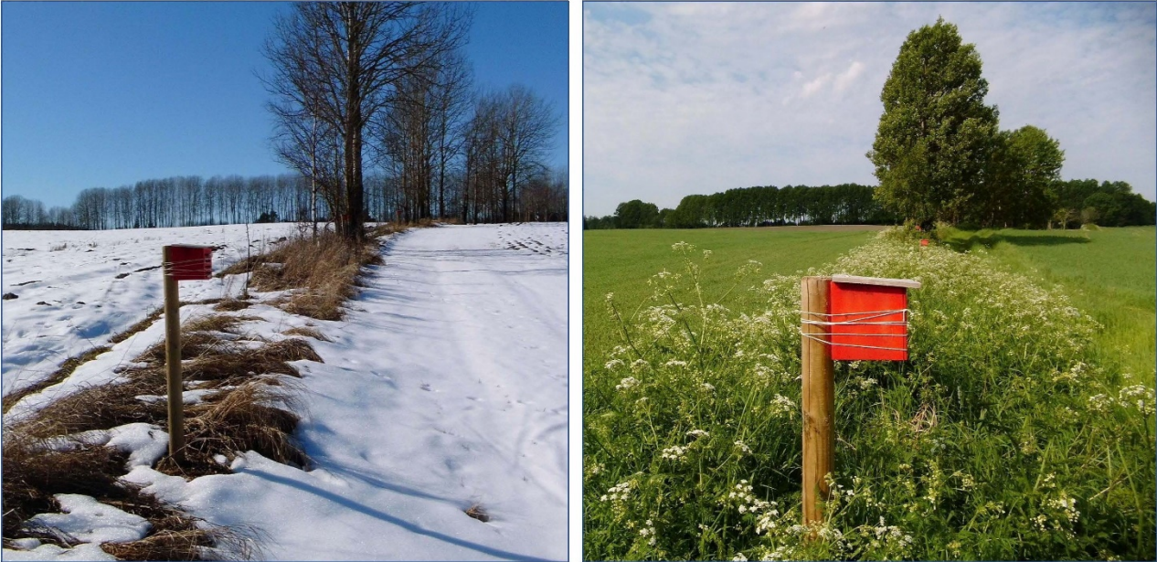
Insekthoteller for gulløyer, her i kantsoner mot eiendomsgrenser, sikre overlevelse fra høst til vår