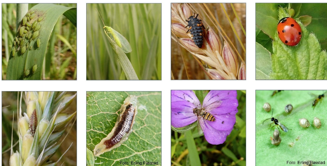
Nyttedyr som bidrar til skadedyrbekjempelse: gulløyer, marihøner, blomsterflue og snylteveps

I forskningsarbeid ved Norsk institutt for bioøkonomi (NIBIO) fokuserer vi på insekter som kan brukes i biologisk plantevern, skadeinsektenes naturlige fiender. Det finnes gode muligheter for å tilrettelegge landbruksarealene våre slik at vi støtter og hjelper disse nyttige insektene, og samtidig sørger for produksjon av høy avling og god matkvalitet. Enkelt sagt må vi sørge for gode leveområder for insekter med tilgang på mat, beskyttelse og overvintringsplasser i landbruksarealer. Dermed etableres nytteinsekter som bidrar til solid skadedyrbekjempelse med redusert bruk av kjemiske plantevernmidler. Redusert bruk av kjemiske plantevernmidler gir redusert mengde plantevernmiddelrester i miljø og i mat, og sørger derfor for bedre matkvalitet.